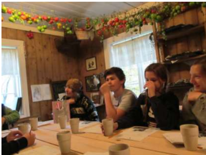
Miskolc, 2014. október 21.

A farm egy közeli iskolával áll szerződésben, a farmon egy iskolai asszisztens dolgozik ilyenkor a házigazda mellett, akinek a bérét az iskola finanszírozza. A diákok tavasszal és ősszel töltenek hosszabb időt a farmon. A diákok számára szükséges felszerelést (munkaeszköz, esőkabát, kézmosó stb.) a farm biztosítja, az iskolások számára egy külön épület áll rendelkezésre. A diákok mellett külföldi gyakornokok is élnek a farmon, így a diákok nemzetközi környezetben vannak, a farmon beszélnek németül, franciául,